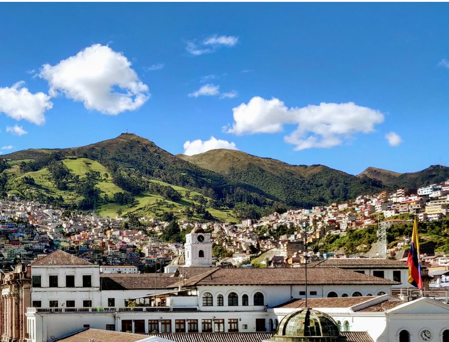
Quito, Equador. Membro da Coalizão de Prefeitos das Américas sobre Migração.

O objetivo deste relatório é identificar o papel que as cidades das Américas têm desempenhado na promoção de vias de migração regular, compartilhar boas práticas e fornecer recomendações de programas e políticas públicas às cidades para ampliar essas vias e fortalecer a governança migratória local.