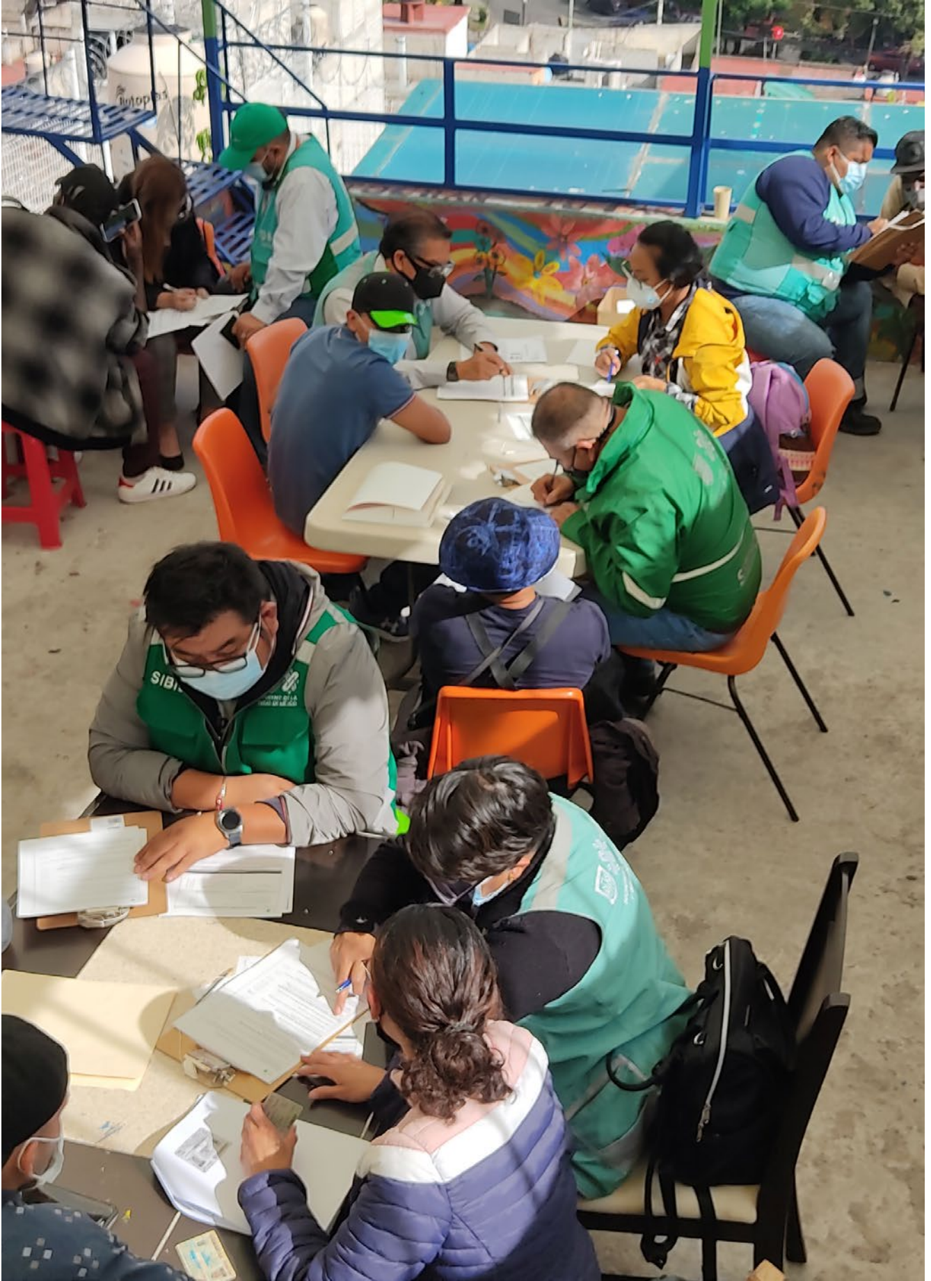
← Cidade do México, México. Beneficiária do Fundo Global de Cidades para Migrantes e Refugiados e membro da Coalizão de Prefeitos das Américas sobre Migração.