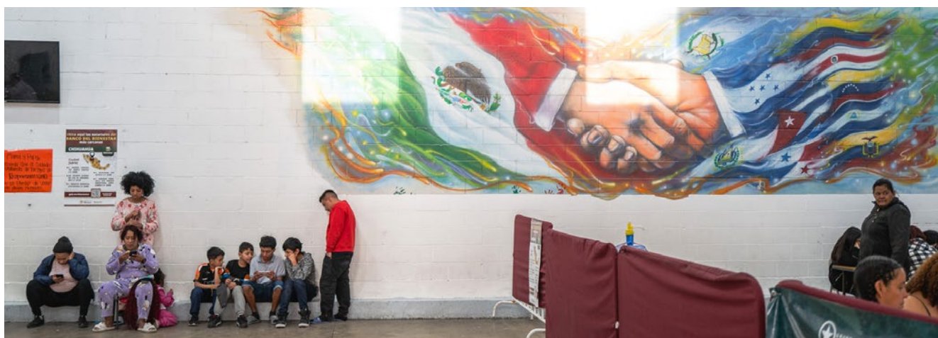
Ciudad Juárez, México. Membro da Coalizão de Prefeitos das Américas sobre Migração.

Uma nova oportunidade seria desenvolver programas-piloto de mobilidade laboral entre cidades da América Latina pertencentes a blocos de integração regional, como o MERCOSUL, 13 a Comunidade Andina (CAN) 14 ou a Aliança do Pacífico. 15 Essas cidades, por estarem inseridas em estruturas supranacionais que reconhecem direitos de residência, circulação, reconhecimento de certificações e emprego entre países membros, podem explorar vias já existentes para impulsionar ações locais de mobilidade laboral.