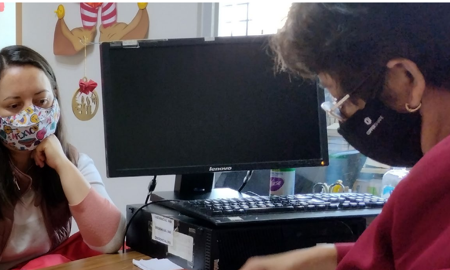
← Cidade do México, México. Beneficiária do Fundo Global de Cidades para Migrantes e Refugiados e membro da Coalizão de Prefeitos das Américas sobre Migração.